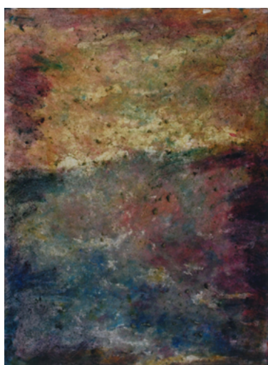
2022/11 – Paysage, 2022. Acrylique sur papier, 76 x 55 cm.

A partir du 16 novembre 2023, la galerie Univer présentera les œuvres les plus récentes de Marc Ronet, paysages, lieux et fleurs, peintures, dessins et gravures. Le travail de Marc Ronet est présenté tous les deux ans depuis 2010 en exposition solo à la galerie.