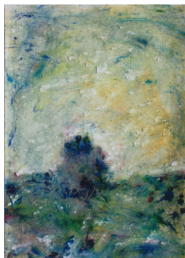
2022/10 – Arbre, 2022. Acrylique sur papier, 76 x 55 cm.