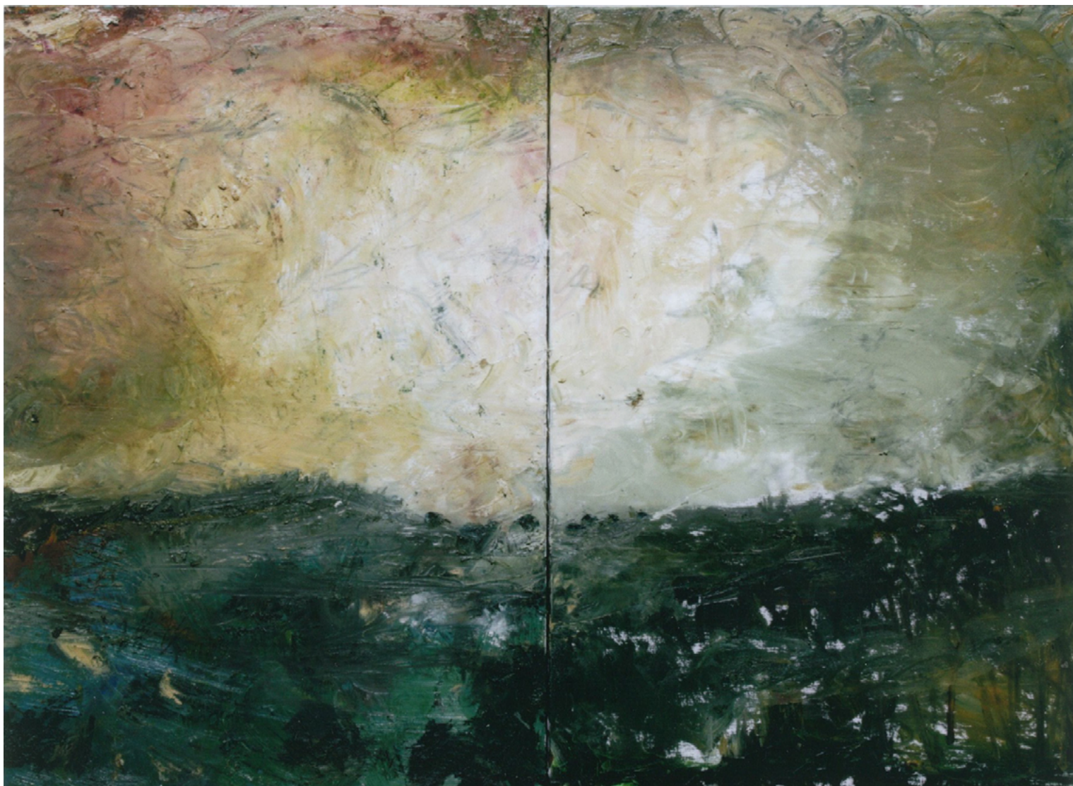
2023/6 – Ciel et sol en mouvement (diptyque), 2023. Huile sur toile, 116 x 178 cm.