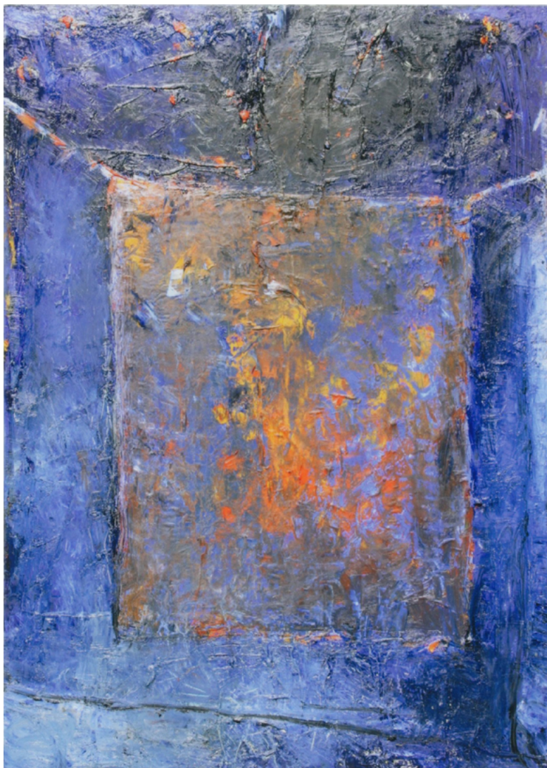
2023/7 – La grande bleue au tissu suspendu, 2023. Huile sur bois et tissu, 162 x 114 cm.