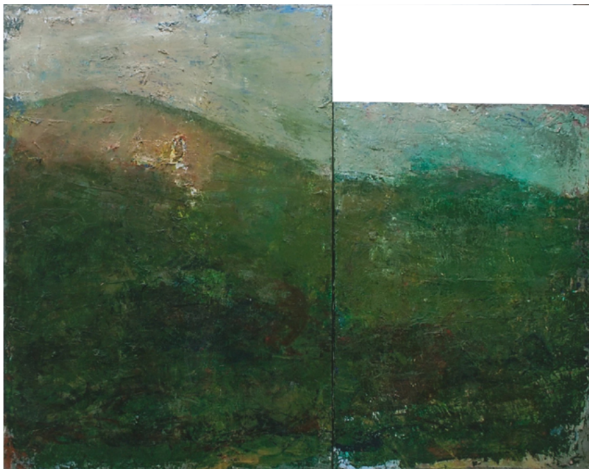
2022/7 – Paysage (diptyque), 2022. Huile sur toile, 116 x 146 cm