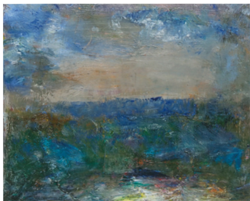
2021/24 – Paysage, 2021. Acrylique sur toile, 46 x 55 cm.