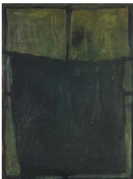
Rideau devant une fenêtre au reflet vert, 2011. Huile sur toile, 130 x 97 cm.