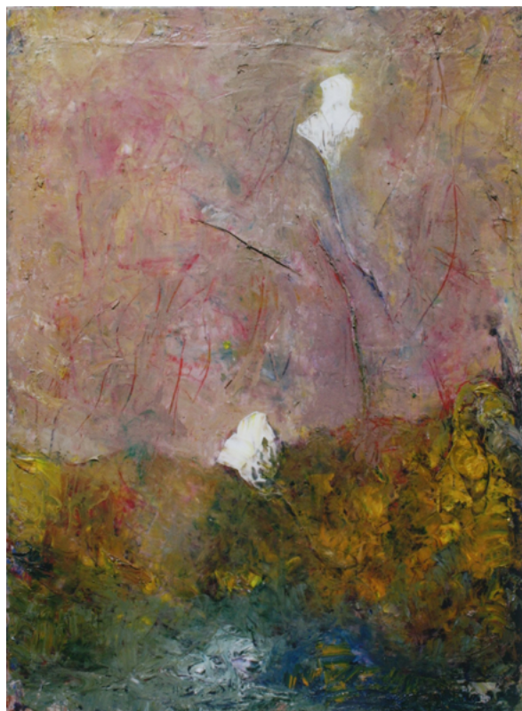
2022/23 – Fleurs blanches aux longues tiges , 2023. Huile sur toile, 130 x 97 cm.