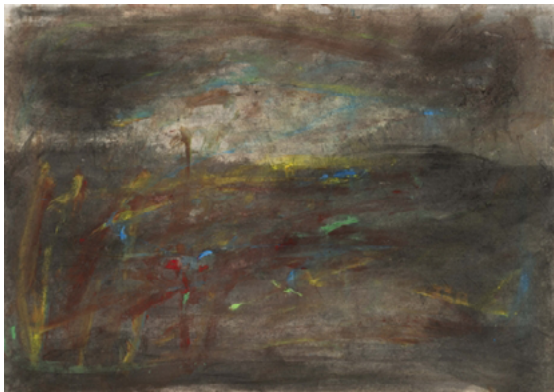
Paysage, 2013. Technique mixte sur papier. © François Pons